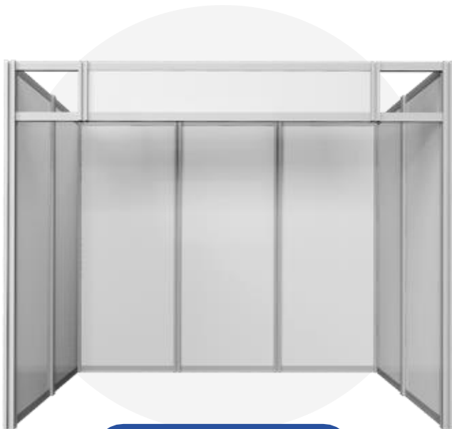
Stand 6m 2